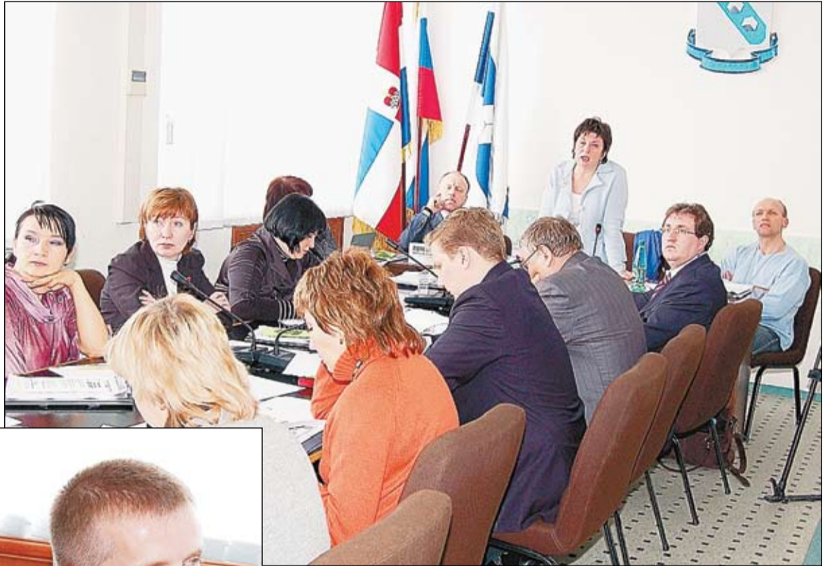
Для многих наших чиновников встреча с гражданским контролем была первой в их жизни

Часть таких регламентов — в органах государственной и региональной власти — Центре занятости населения, налоговой инспекции, соцзащите, ГИБДД, кадастровой палате, — проверили в Березниках. Всего 9 регламентов — немного, но и это уже позволило говорить о выявленных «слабых местах», точках неблагополучия.