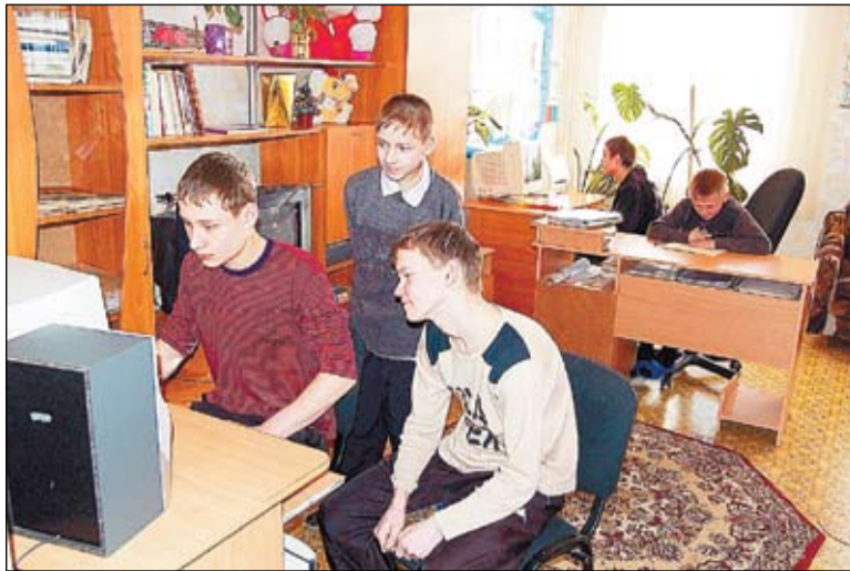
С родным домом расставаться трудно...

В чем здесь еще серьезная проблема? Дети, которые воспитываются в Березниковском детском доме, — это дети Березников, за ними либо закреплено жилье, либо они здесь состоят на учете. У многих сохранились и родственные связи. Сегодня, когда их разбрасывают по городам Пермского края, разрываются, во-первых, родственные связи, и так едва сохраняющиеся, с другой стороны, ухудшается их право на сохранение жилого помещения. Практика в Пермском крае показывает, что если ребенок перемещен с той территории, где за ним было закреплено жилье, на другую, то со временем он этого жилья фактически лишается. Ибо никто за жильем не следит, оно ветшает, приходит в негодность, становится аварийным, в результате ребенок остается без жилья. А подтверждением тому является растущая в Пермском крае очередь детей-сирот, которые нуждаются в жилье. За прошлый год она снова выросла на 15 процентов и составляет уже более 9 тысяч человек. И это — не вновь выявленные дети без жилья, а дети, за которыми было закреплено жилое помещение, но в итоге оно пришло в негодность, и они в нем сейчас проживать не могут. Следовательно, они нуждаются в жилье, и их вынуждены, как детей-сирот, ставить в очередь.