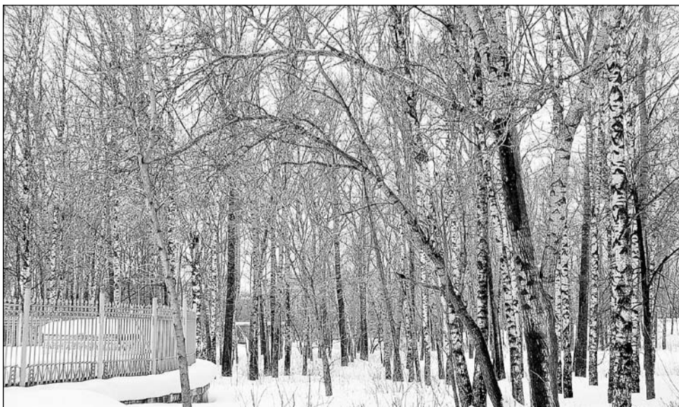
Все живое тянется к музыке

Так что есть здесь и танцоры со стажем, и совсем молодые, но одинаково счастливо застывшие в своем безмолвном танце.