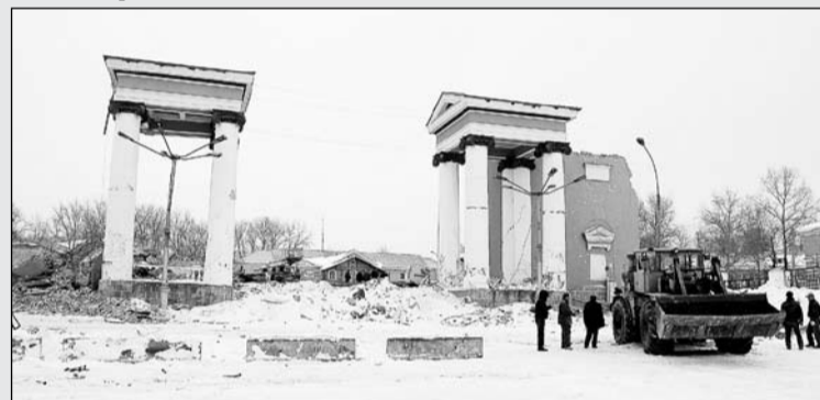
ДК калийщиков: остатки бывшего величия