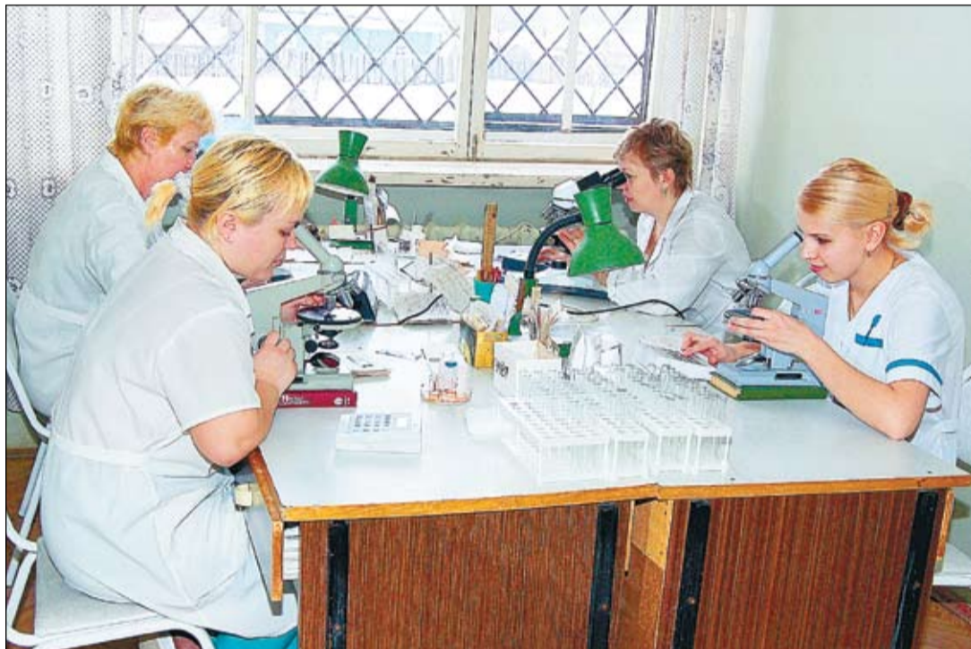
Лаборантов заменят машины?

Почувствовать настроение весеннего праздника женскому коллективу лаборатории не удалось: начальство оповестило о том, что за грядущими переменами неминуемо последует значительное сокращение персонала. Предположительно, 50-60 процентов от общей численности сотрудников всех лабораторий, которых сегодня насчитывается порядка 70-ти человек. И произойдет это уже в четвертом квартале текущего года.